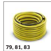
79, 81, 83