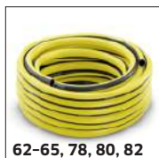
62-65, 78, 80, 82