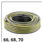
66, 68, 70