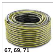
67, 69, 71